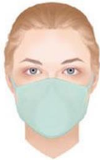
FFP2 / FFP3 légzésvédő maszk, szelep nélküli