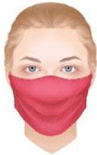
házilag készült arcvédő maszk