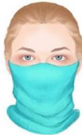
sál / kendő